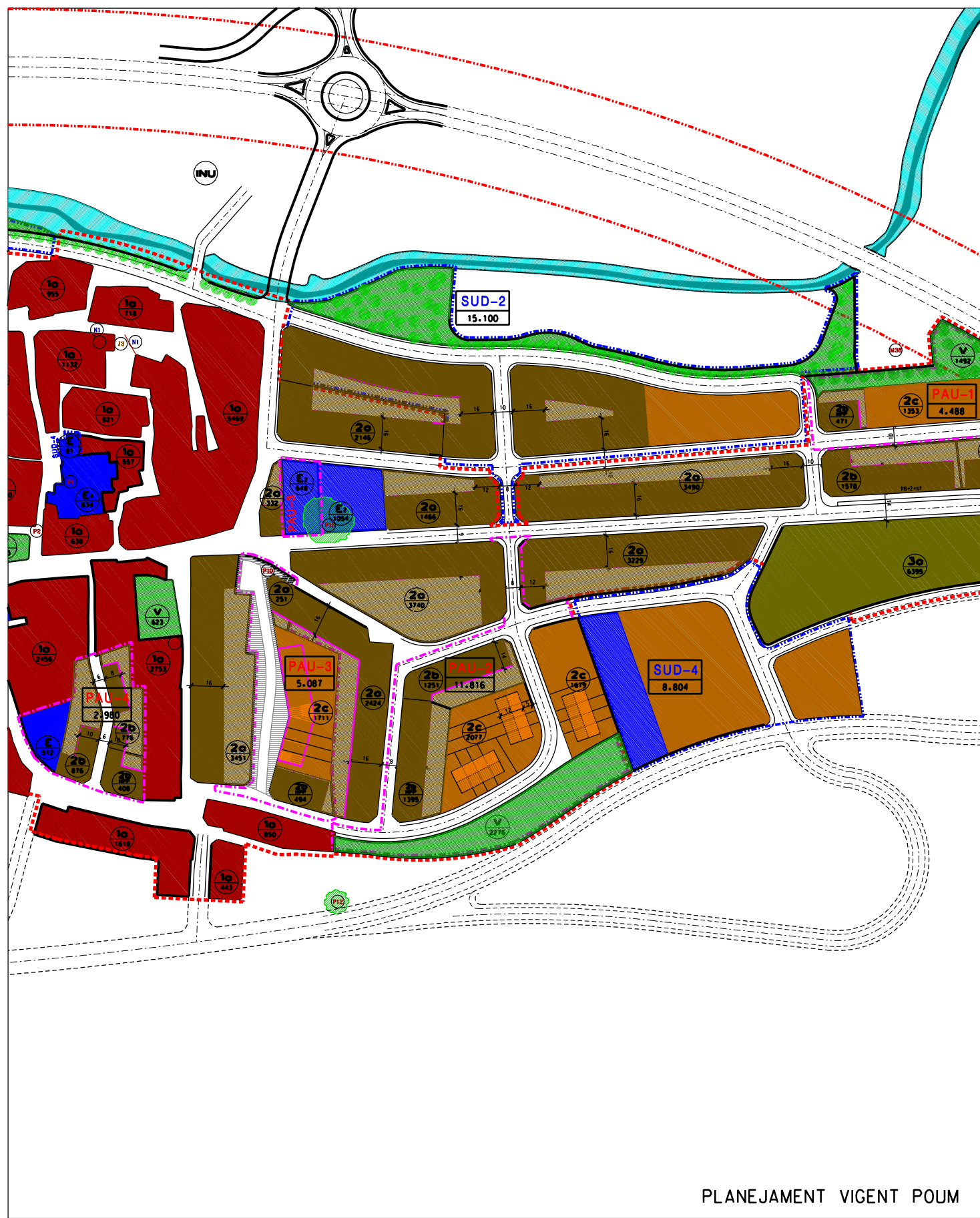
PLANEJAMENT VIGENT POUM